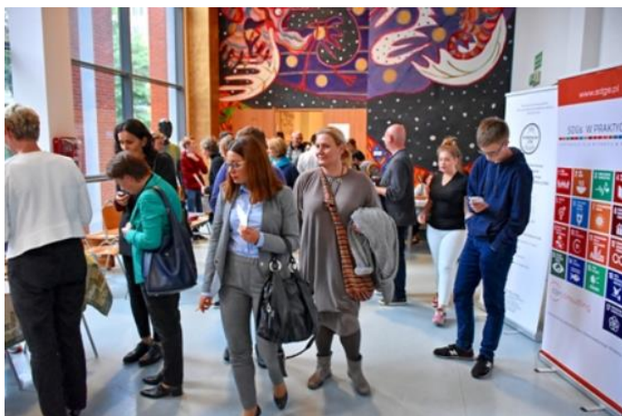
Goście poprzedniej edycji.

Jego głównym celem jest upowszechnienie wiedzy na temat Zrównoważonego Rozwoju i Społecznej Odpowiedzialności Biznesu m.in. poprzez promocję Agendy ONZ.